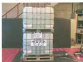
Abb. 2 : Zugversuch mit Europalette 1000kg in Längsrichtung