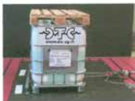
Abb. 3 : Zugversuch mit Gitterbox 500kg in Querrichtung