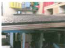
Abb. 1 : Rutschhemmende Beschichtung